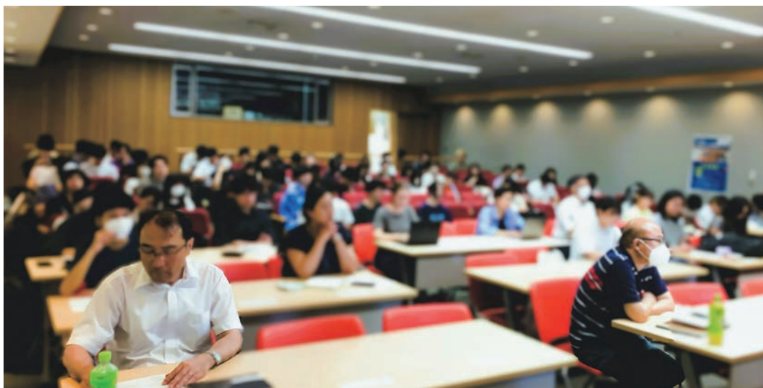
ロイ氏の講演に聞き入る参加者たち