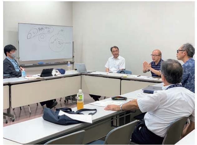
第5回定例研究会（日中交流予備研究会） 議論の様子