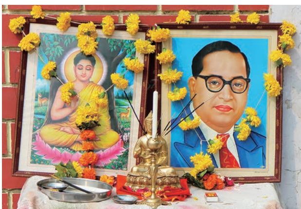
写真①：インド仏教式の祭壇 (左ブッダ、右アンベードカル博士)

2024年3月3-10日にインド・マハーラーシュトラ州にある二つの都市(プネー市とナーグプル市)を訪れ、インド仏教の現状に関する調査を行う機会を得たので、この場をお借りしてその成果の一部を報告させていただきたい。紀元前5世紀頃ガウタマ・シッダールタ(ブッダ)を開祖として誕生した仏教は、全インドに拡がり十数世紀にわたって隆盛を極めたものの次第に衰退し、イスラーム勢力の侵入やヒンドゥー教との同化等の諸原因によって13世紀頃インドの地から姿を消した。その後、約750年にわたって仏教のない時代が続くが、20世紀になってインド仏教は新しい形で息を吹き返すことになる。2011年の国勢調査によると、仏教徒の割合は全人口の約0.7%(約844万人)とされているものの、調査の信頼性や履行状況について疑問視する声もあり、実際数は数千万~1億5千万人にのぼるとも言われている。