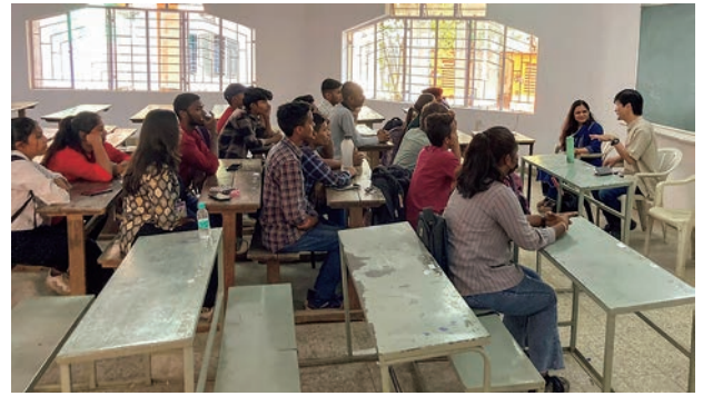
写真⑥：アンベードカル・カレッジの学生との交流の様子

今回の現地調査で最も印象に残ったことは、インドという国にみなぎる圧倒的な「活力」と「勢い」である。その活力と勢いは何に起因するのであろうか。25歳以下の人口の割合（約55%）や国民全体の平均年齢（28.43歳）にも如実に表れている通り、第一に若者の人口比が極めて高いということがあるだろう。もう一つは、月並みな言葉になるが、多くの人々が「夢」と「希望」をもつことができる社会になっているという点である。人口の多さから他国と比べると失業率は若干高いものの、経済は順調に