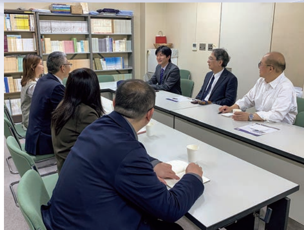
様々な話題で意見交換

同研究所はまた、海外における中国研究・中国学の現状について調査研究を行うと共に、多面的な中国という国の実像をファクトベースで世界に提示するという役割も担っているとのことである。