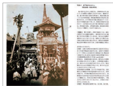
古写真を利用した写真引きの例(『一枚の写真』21頁)