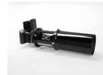
カンコー 2600/日本カメラ博物館所蔵

第一次世界大戦後の好景気と大正デモクラシーの追い風を受け、関西の天文学は大きく発展しました。独学で反射鏡研磨法を広めた山崎正光、その技術を世界水準へ高めた中村要、望遠鏡製作を事業化した西村製作所、そして反射望遠鏡機を開発した宮澤堂。宮澤は後に関西光学研究所を設立し、反射光学系の研究と工業化を推進しました。こうして京都で育まれた光学系技術が、戦時下をどう乗り越え発展したのか。反射望遠鏡機と関西光学工業(カンコー)の宮澤堂の資料を中心に、その軌跡を紹介します。