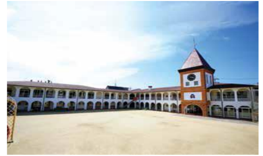
すみれ幼稚園（京都市山科区）

「遊び」から学ぶとは、集団を通して心身ともにたくましく、力強く、心優しい子どもに育てること、仲間との関わりや基本的な生活習慣・知識を身につけることです。すみれ幼稚園は、力強く「生きる力」を育みます。