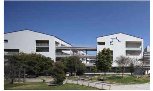
京都産業大学附属中学校・高等学校（京都市下京区）

気概…確固たる信念を持ち、どのような困難に直面しても挫けず、前向きに思考し行動する精神のつよさを育てる。