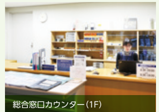
総合窓口カウンター(1F)