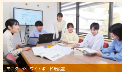
モニターやホワイトボードを設置