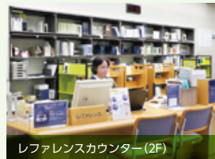
レファレンスカウンター(2F)