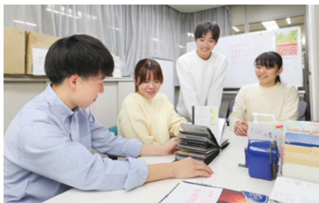
図書館サポートチーム「ビブリア」

学生対象のさまざまなガイダンスを開催しています。図書館の施設紹介から文献の探し方、レポートの書き方、就職活動の進め方まで、学べることは多種多様。図書館のサービスをフル活用すれば、学生生活の可能性が大きく広がると思います。(⇒P7)