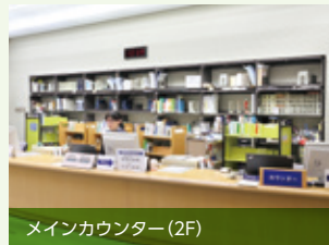
メインカウンター(2F)

学びに関することなら何を聞いてもいい場所が2Fの「レファレンスカウンター」です。専任のスタッフが常駐し、利用者のさまざまな質問に対応します。先生も活用する図書館の充実したサービスを、みんなも積極的に活用しましょう！