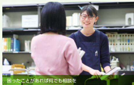
困ったことがあれば何でも相談を