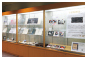
総合窓口横展示企画