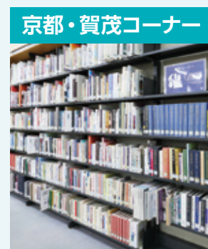
京都・賀茂コーナー

キャンパスがある京都・賀茂エリアの本や雑誌をまとめた、京都産業大学ならではのコーナーです。