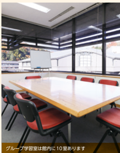
グループ学習室は館内に10室あります

グループ学習室はみんなで話をし ながら一緒に学べるスペース。学内 には、ほかにもグループで学べる場 所が複数ありますが、周辺に豊富な 資料がある図書館は学習に最適の 空間です。図書館にはグループ視聴 覚室もあります。