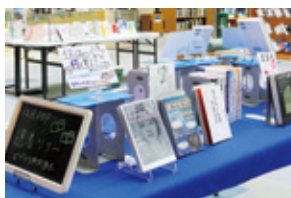
ピブリアPOP展示企画