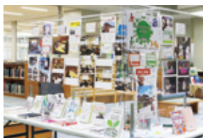
他部署コラボ展示企画