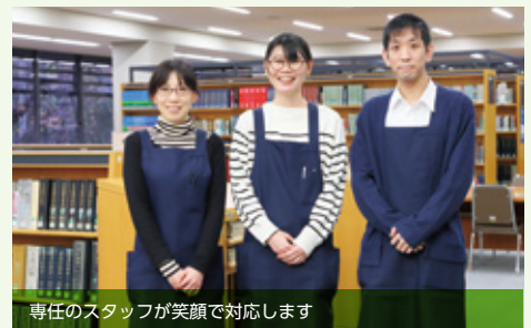
専任のスタッフが笑顔で対応します