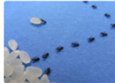
お米よりも小さなものも 作れます