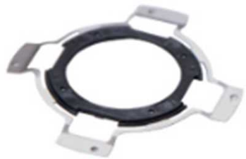
金属+整形セット加工