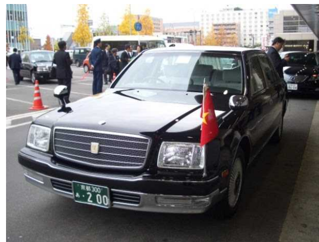
ファーストクラスハイヤー (センチュリー)