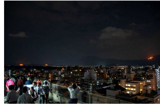
五山の送り火 @ヤサカ烏丸御池ビル