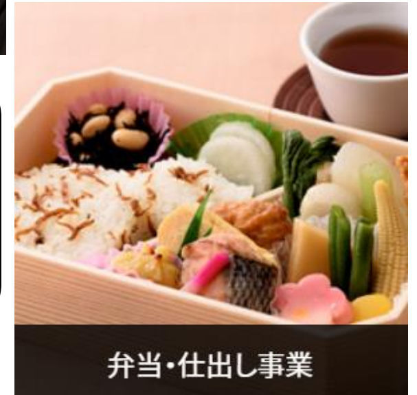
弁当・仕出し事業