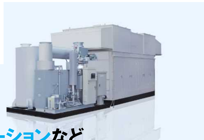
コージェネレーションなど