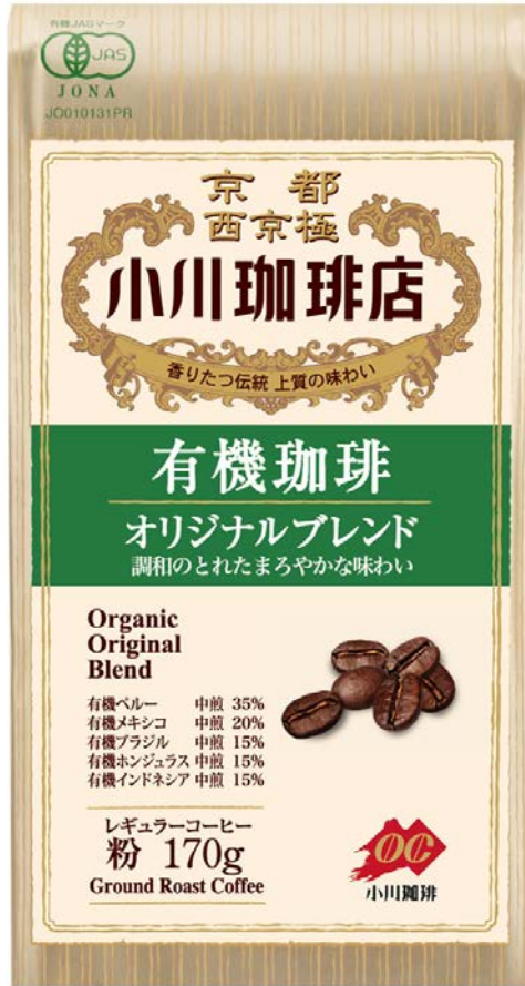
レギュラーコーヒー