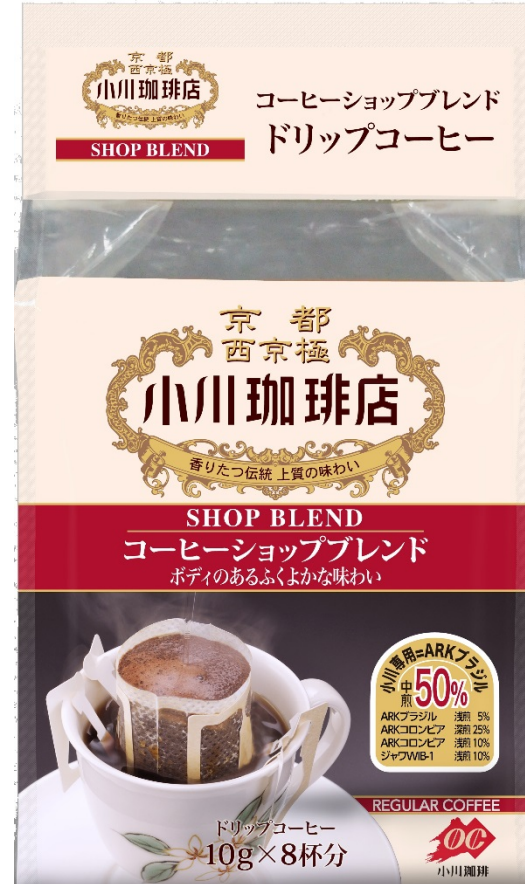
ドリップコーヒー