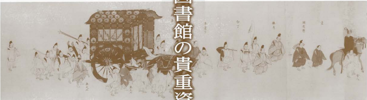
「加茂神社行幸絵巻」京都産業大学図書館蔵