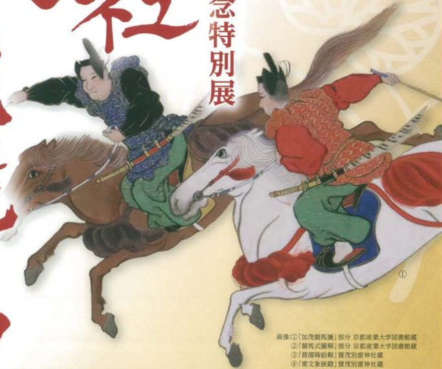
画像:①[加茂競馬圖]部分 京都産業大学図書館蔵 ②[騎馬式圖解]部分 京都産業大学図書館蔵 ③[舊雷時驗鞍]賀茂別雷神社蔵 ④[雷文象嵌鎧]賀茂別雷神社蔵