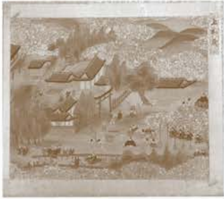
「京名所」京都産業大学図書館蔵