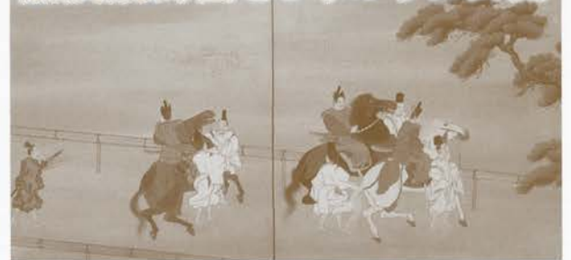
「加茂競馬圖」京都産業大学図書館蔵