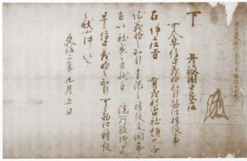
「源頼朝袖判下文」賀茂別雷神社蔵