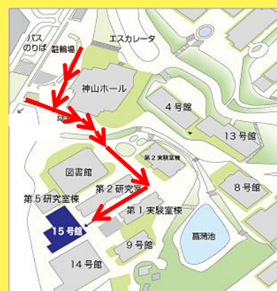
京都産業大学地図

(2) 京都市営地下鉄「北大路駅」下車→市バス(北3号系統)または京都バスで京都産業大前下車