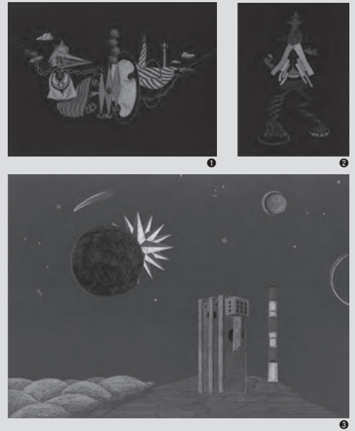
① 渦巻きダンスをするフェデリコ ② リミニの川でバラードをする道化師 ③ 我々は移動しなければならぬ

丹波口(JR)…徒歩約7分 大宮(阪急)…徒歩約11分 四条大宮(京福)…徒歩約11分 ※駐車場・駐輪場はございませんので、ご来館の際には公共交通機関をご利用ください。 問合せ先 京都産業大学むすびわざ館事務室 (平日 9:00~16:30) TEL 075-277-0254 FAX 075-277-1699 HP https://www.kyoto-su.ac.jp/facilities/musubiwaza/gallery/index.html