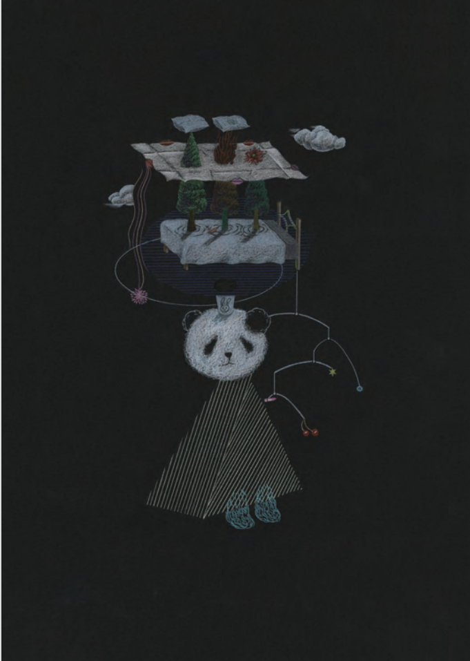
『果々』 2020年/「立つ人」シリーズより