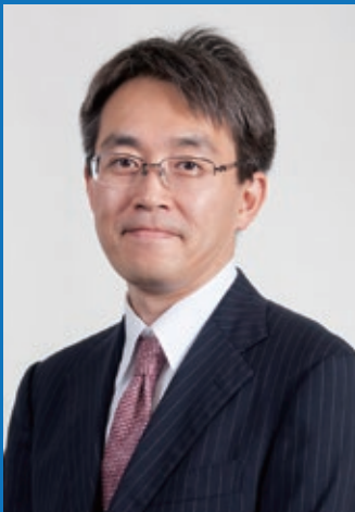
第2回 羽生善治氏 (将棋棋士)