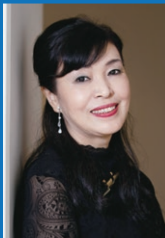
第5回 池田理代子氏 (劇画家・声楽家)