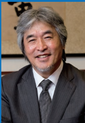
第4回 山極壽一 教授 (京都大学総長)