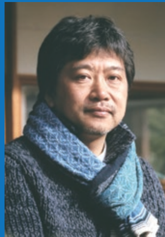
第3回 是枝裕和氏 (映画監督・ テレビディレクター)