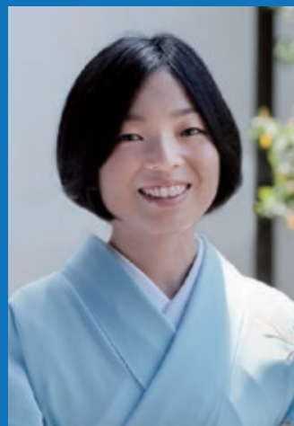
第7回 彬子女王 殿下 (本学日本文化研究所 専任研究員)

特別対談シリーズ「マイ・チャレンジ」は、 学生および高校生向けの企画です。 一般の方の聴講は、各回定員までとさせて いただきますので、ご理解をお願いいたします。