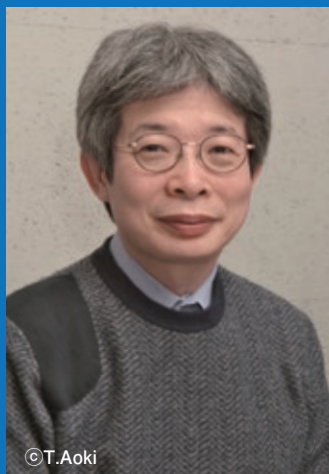
第6回 平田オリザ氏 (劇作家・演出家)