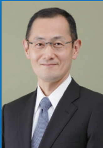
第1回 山中伸弥 教授 (京都大学 iPS細胞研究所所長・教授)