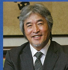
第4回 山極壽一教授 (京都大学総長)