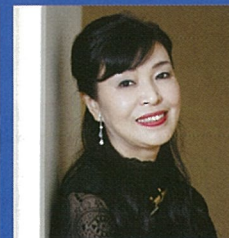
第5回 池田理代子氏 (劇作家・声楽家)