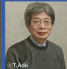
第6回 平田オリザ氏 (劇作家・演出家)

特別対談シリーズ「マイ・チャレンジ」は、 学生および高校生向けの企画です。 一般の方の聴講は、各回定員までとさせて いただきますので、ご理解をお願いいたします。