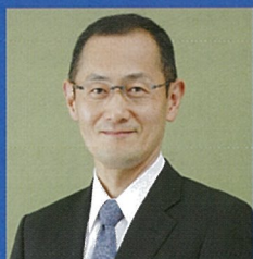
第1回 山中伸弥教授 (京都大学 iPS細胞研究所長・教授)