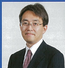
第2回 羽生善治氏 (将棋棋士)