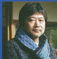
第3回 是枝裕和氏 (映画監督・ テレビディレクター)