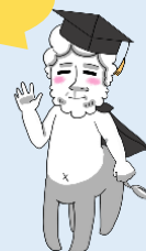
SNS公式キャラクター むすぶくん