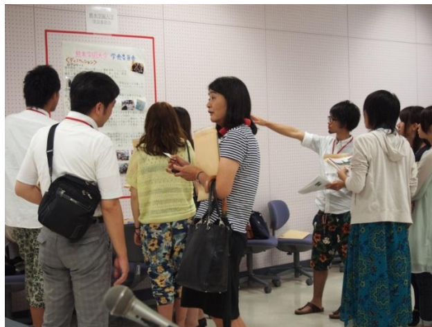
昨年のポスターセッションの様子

ポスターセッションとは、壁またはホワイトボードに報告をまとめたポスターを貼りだし、掲示者が自身の報告を聞きに来た方に適宜説明を行うことです。ポスターセッション中は、複数の団体が同時にポスターを貼り出します。聞き手は自由に興味のある団体の発表を聞きに行き、ディスカッションすることができます。