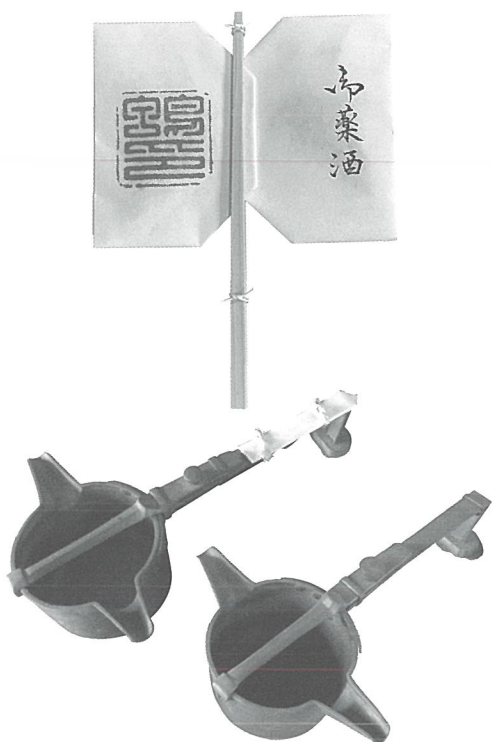
資料：「御薬酒」、「銚子」賀茂御祖神社 所蔵

本企画展では、新嘗祭や歳旦祭で用いられる酒から、酒と神事の関わりについて読み解きます。