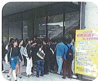
● 会場入口風景 ●