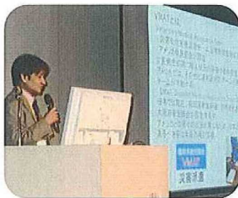
● 講演会 ●