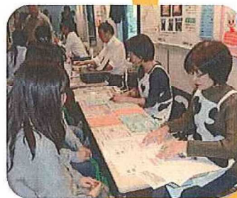
● 展示ブース風景 ●