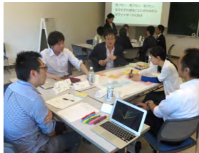
学生との対話についての意見交換

第 2 回研修会は、各教員が第 6 週目までに実施した「教員—学生間の授業に関する対話」の結果を持ち寄り、学生の要望や意見へのフィードバックなど、学生との向き合い方について意見交換を行い、各教員の様々な思いや、課題などが共有されました。