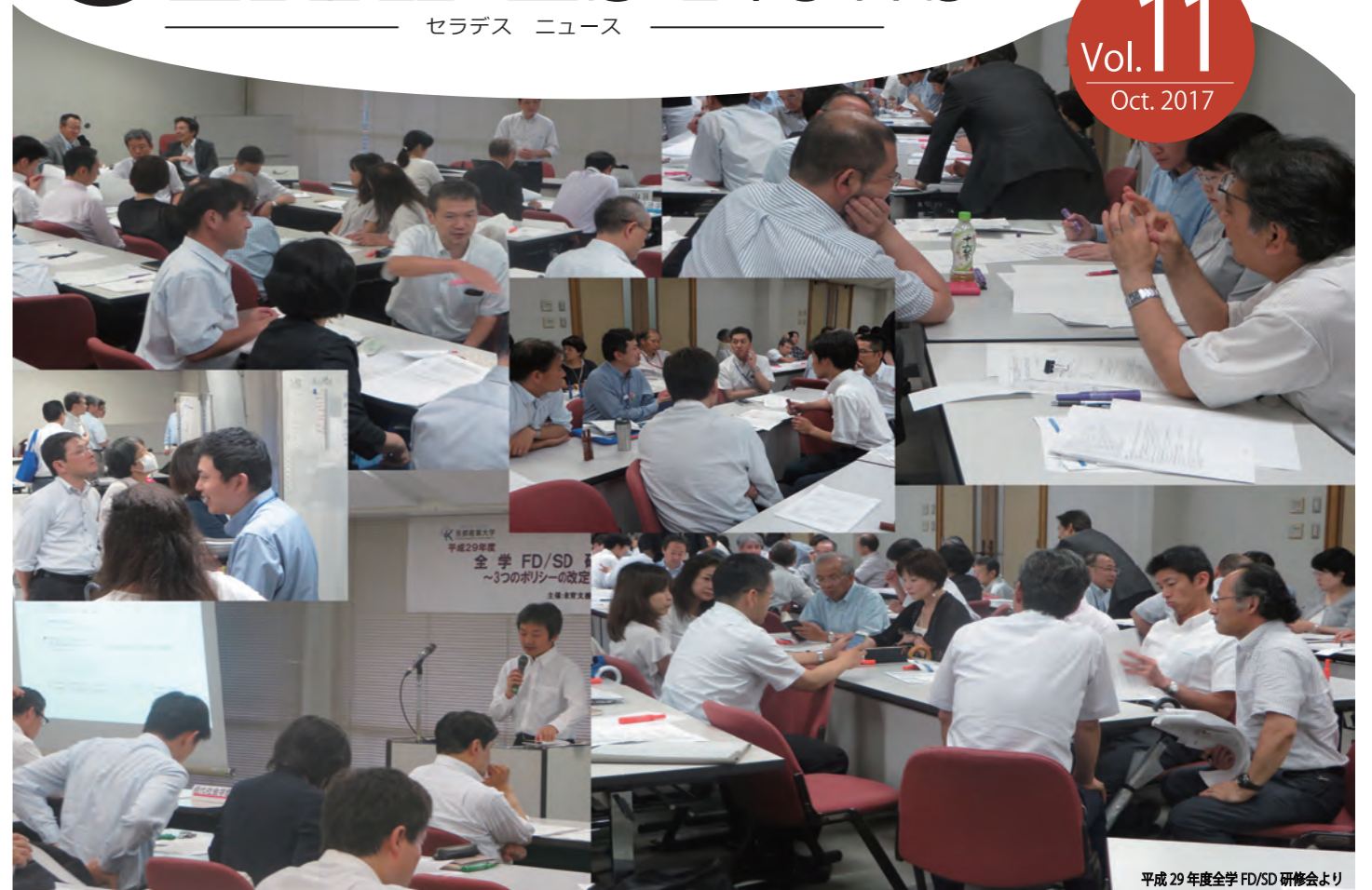
平成 29 年度全学 FD/SD 研修会より