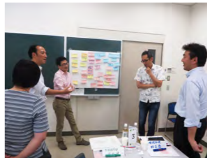
議論を深める参加教員