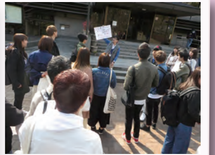
■チェックポイントでクイズを出題

平成29年3月、現代社会学部の入学予定者を対象としたキャンパスオリエンテーションの企画に学ファシが参画しました。同学部の入学予定者同士の関係づくりとキャンパス理解を目的としたもので、学ファシと現代社会学部の教員が協働で企画・運営しました。実施の約2か月前からミーティングを重ね、入学生同士の交流に向けた工夫について検討してきました。当日は約140名の入学生がグループに分かれて学内を巡り、学ファシは学内の4つのチェックポイントに待機し、チェックポイントにまつわるクイズを出題。入学生同士の自己紹介が高得点に結びつくような工夫を盛り込んだこともあり、終了後にはグループに和気あいあいとした雰囲気が生まれ、入学生同士の交流が深まった様子でした。