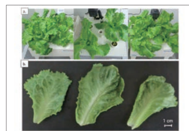
野生型(左)と組換えレタス2系統(中、右)の表現型。