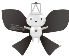
神山天文台マスコットキャラクター ほしみ〜るちゃん®