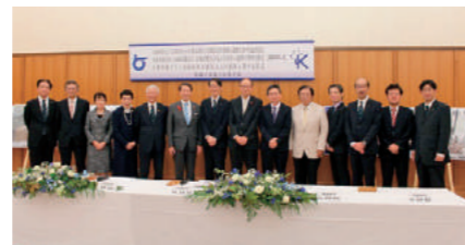
鳥取県との包括協定

2016年度、地域連携については新たに1県1市(鳥取県・岡山県総社市)と連携協力に関する協定を締結しました。これにより連携協力に関する包括協定締結先は計9地域となりました。就職支援に関する連携については出身学生が多く、かつ地域圏の要となる県を中心に新たに6県(岡山県・広島県・福岡県・新潟県・愛媛県・高知県)と協定を締結しました。これにより就職支援協定の締結先は12県(包括協定の鳥取県を含む)となりました。