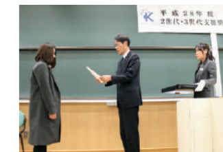
2世代・3世代支援奨学金表彰式