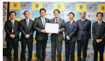
高知県との就職支援協定