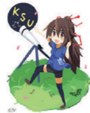
経営学部創設50周年イベント 応援キャラクター「神山むすび」 作・なっか(経営学部卒業生)