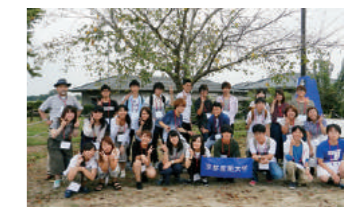
熊本・山鹿フィールドのフィールドワーク参加者 (荒木総長の出身地を訪問)

国の内外を問わず社会の諸分野において活躍し、社会的貢献を果たし、顕著な業績をあげ、本学の名声を高めた卒業生の方に対し、その功績を称え顕彰する制度です。