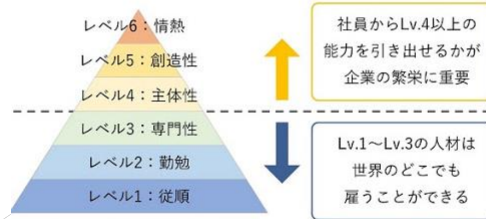
ゲイリー・ハメル「経営の未来（仕事の能力のピラミッド）」