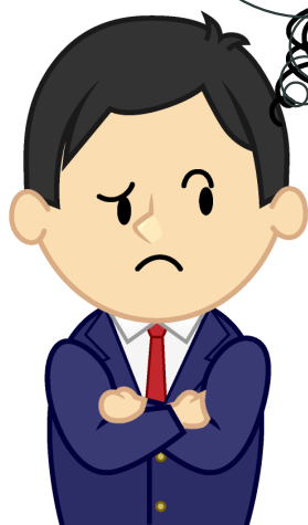
京都市立京都奏和高校三年生