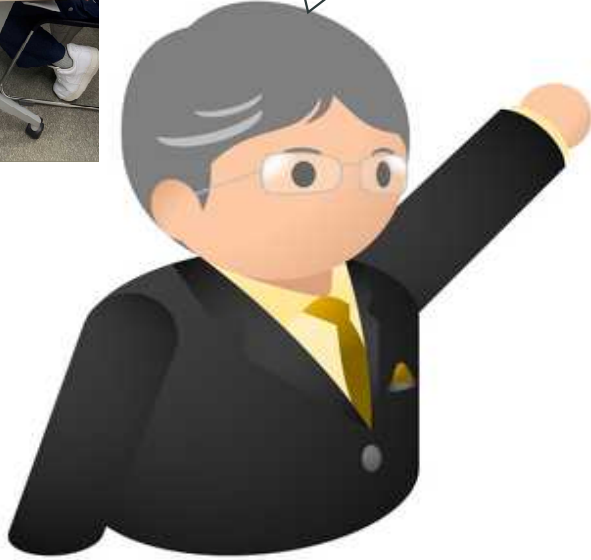
京都中小企業同友会の方々