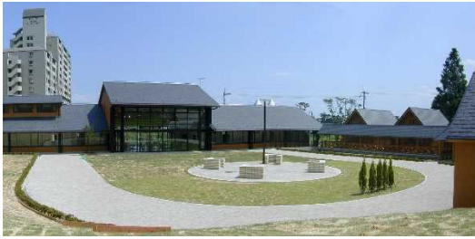
バーベキューコーナー（可動式のコンロ有）