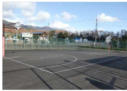
バスケットコート（1面）